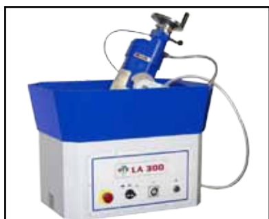
Allestimento standard Standard machine Стандартное исполнение