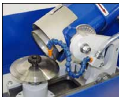
Affilatura lama circolare Sharpening circular blade Заточка дискового ножа