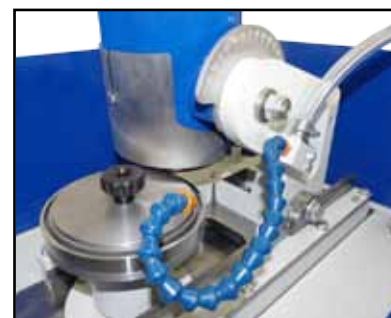
Affilatura controlama Sharpening counter blade Заточка контрножа