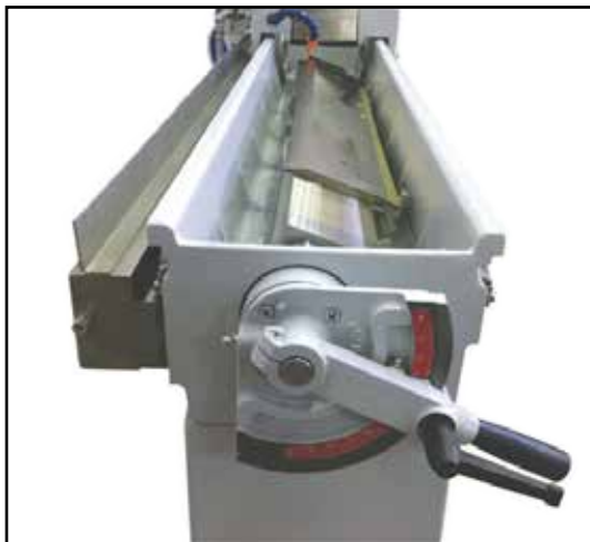
Piano magnetico rotante 0°-90°