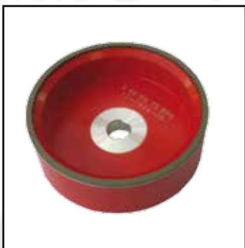
Чашечный шлифкруг алмазный и зльборовый Ø150