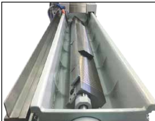
Barra per riferimento da filo