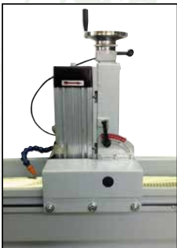
Узел автоматического спуска шлифкруга